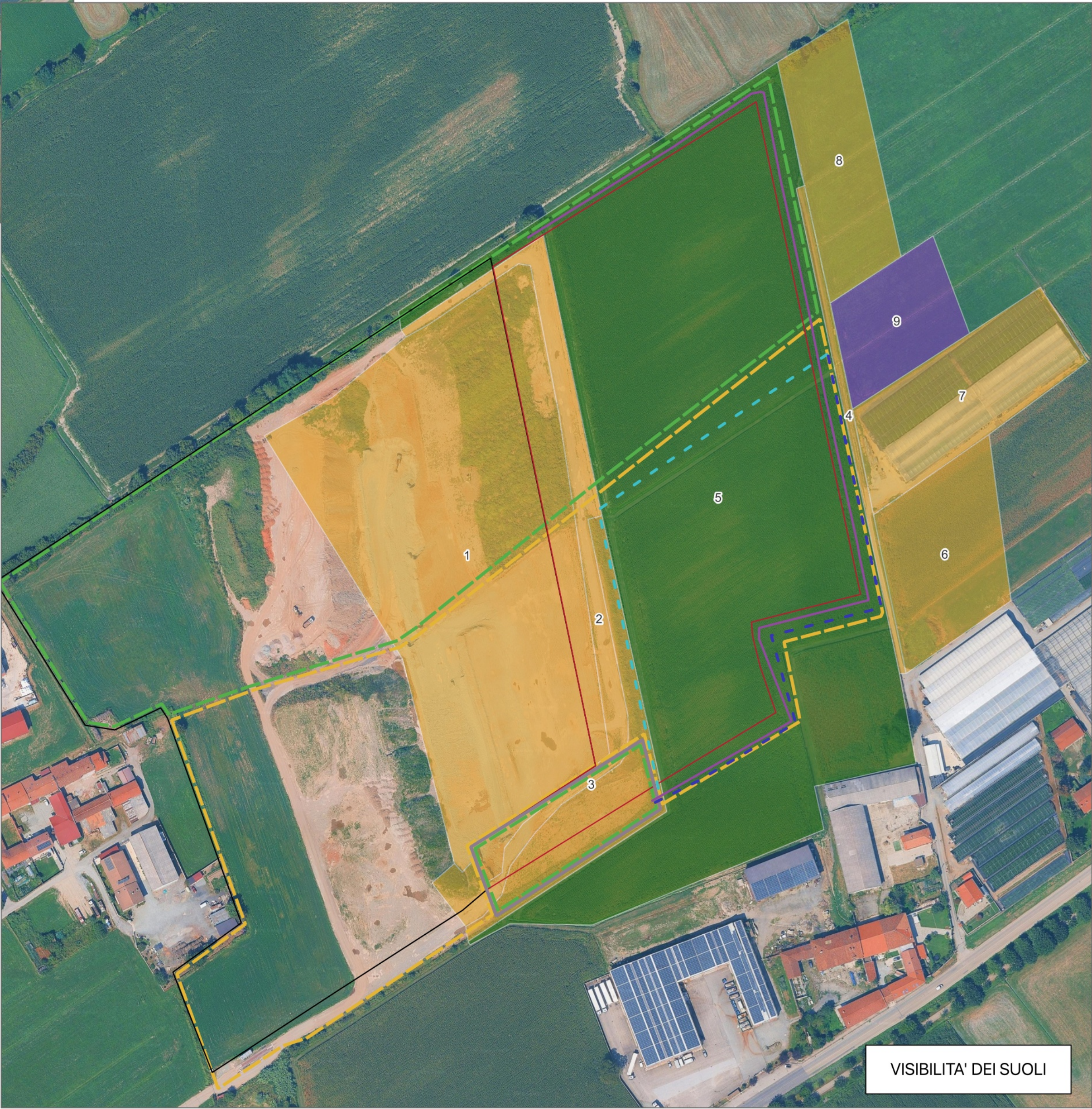
VISIBILITA' DEI SUOLI